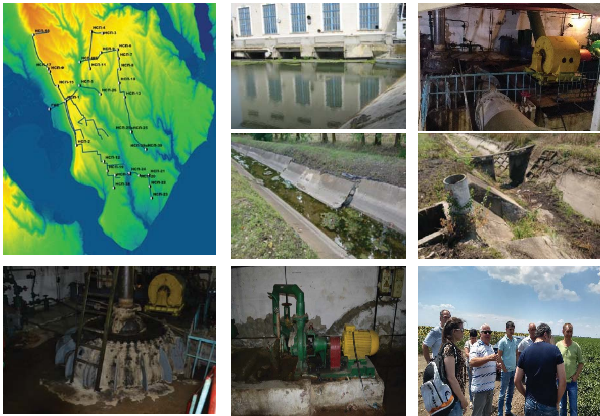
Рис. 6. Нижньо-Дністровська ЗС

– заміна на головній насосній станції (ГНС) та станціях підкачки існуючих висо-