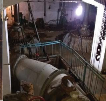
Рис. 3. Технічний стан Головної насосної станції в Одеській області

• недостатньою забезпеченістю сучасним високотехнологічним дощувальним обладнанням на площі більше 650 тис. га, відсутністю дієвих механізмів державної підтримки виробництва та придбання засобів поливу та нестачею коштів у сільгоспвиробників на оновлення парку дощувальних машин. Здебільшого використовується морально застаріла широкозахватна дощувальна техніка, яка перевищила свій нормативний ресурс роботи у 2,0–2,5 рази, внаслідок чого питомі витрати енергії на зрошення збільшуються. На сьогодні 8 тис. таких дощувальних машин у робочому стані знаходиться близько 5 тис. одиниць. Але вони також не в змозі забезпечити проведення якісних поливів відповідно до науково обґрунтованих режимів зрошення. Слід відзначити, що попит сільгоспвиробників на дощувальну техніку зараз здебільшого задовольняється за рахунок таких іноземних марок машин як “Valley”, “Zimmatic”, “Reinke”, “Centerliner”, “Linestar” “Bauer” та інші. Проте на сьогодні ПАТ «Завод Фрегат» освоїло виробництво сучасних широкозахватних дощувальних машин фронтального і кругового переміщення із забором води