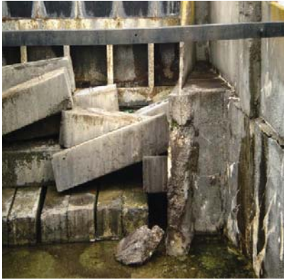
Рис. 1. Стан залізобетонних конструкцій аварійного полігонального водоскиду в Херсонській області