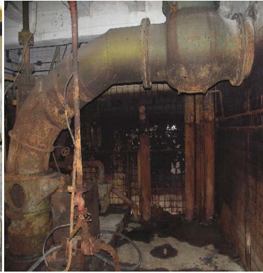
Рис. 2. Докова частина польдерної насосної станції в Закарпатській області