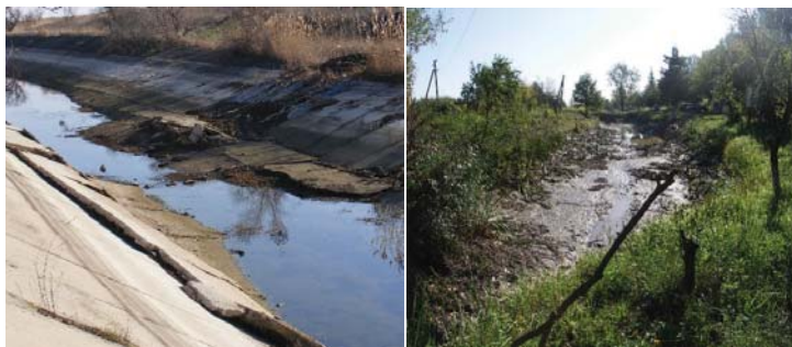
Рис. 4. Технічний стан каналів

• значними (до 40–50%) непродуктивними втратами води на шляху її транспортування до поля через незадовільний стан облицювання меліоративних каналів, водосховищ, басейнів накопичувачів та ін. (рис. 4, 5). Зважаючи на те, що більшість магістральних, розподільних каналів, водосховищ і басейнів накопичувачів були побудовані або реконструйовані 40–50 років тому, нормативний термін роботи облицювання закінчився, його технічний стан оцінюється як незадовільний або навіть критичний і, як наслідок, фільтраційні втрати зростають, а коефіцієнт корисної дії споруд зменшується [8, 14]. Встановлено, що найменші фільтраційні втрати води зафіксовані на Каховській зрошувальній системі, як найновіший і більш технологічно досконалий побудований в Україні. Одночасно, на одній з перших великих зрошувальних систем