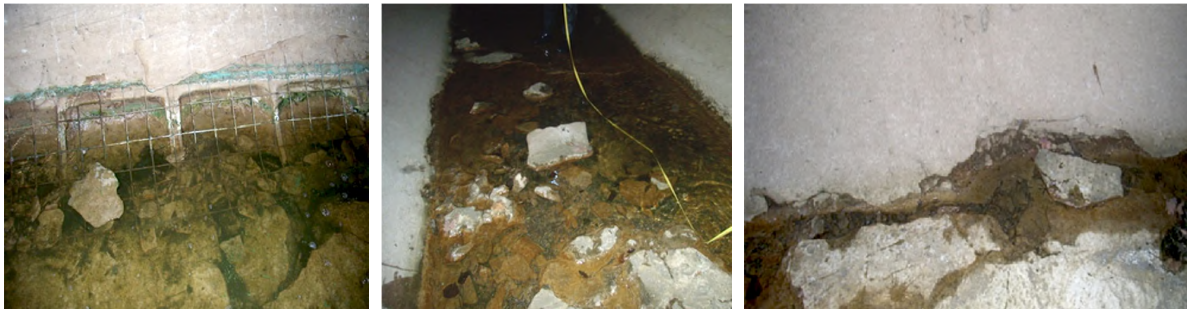
Рис. 3. Характерні дефекти гідротехнічного тунелю № 1

Для проведення обстежень було розбито вимірвальну мережу, що починалась з нульової позначки біля кордону вхідного порталу та орієнтована униз по ухилу тунелю з кроком розбивки 5м. Візуальні спостереження та віброакустичну діагностику об'єкта проводили із прив'язкою положення і розмірів аномалій до вимірвальної мережі. При візуальному обстеженні виявляли та проводили картування на поверхні розгортки тунелю знайдених аномалій та характерних дефектів (рис. 3).