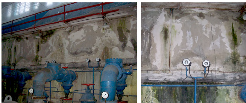
Рис. 4. Протічки в доковій частині Кочурської насосної станції

Унаслідок багаторічної експлуатації на усіх досліджуваних НС спостерігається часткове руйнування залізобетонних елементів споруди, протікання, тріщини, розшліщення бетону (рис. 4).