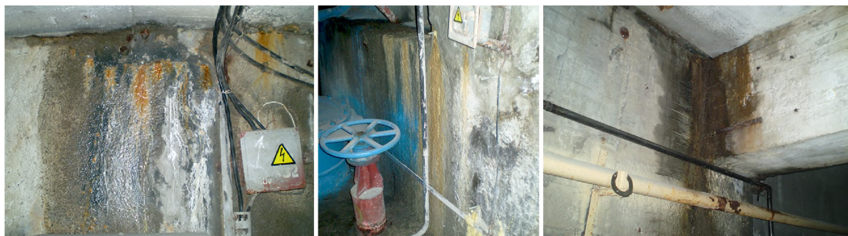
Рис. 2. Місця фільтрації води усередину споруди

У місцях сполучення залізобетонних конструкцій стін та балок з перекриттям та в зоні стикового з'єднання стін та підлоги присутня фільтрація води крізь тіло бетону з ділянками зруйнованого захисного шару бетону в місцях протікання (рис. 2).