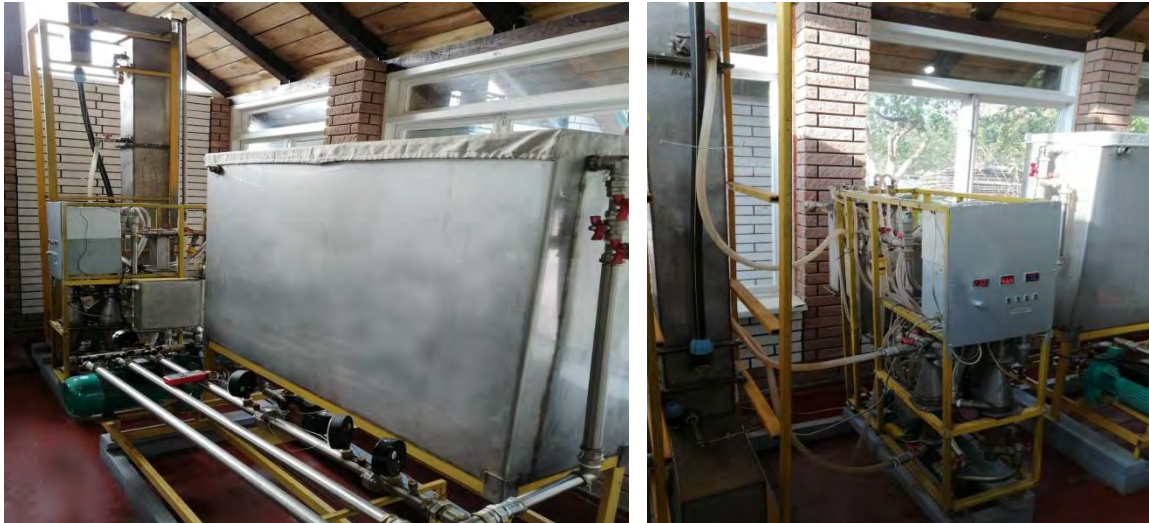
а) в б) Рис. 2. Зовнішній вигляд виготовленого прототипу АСОВ: а – блок подачі модельного водного розчину з вузлом гідродинамічної кавітації та нагріву води; б – АСОВ