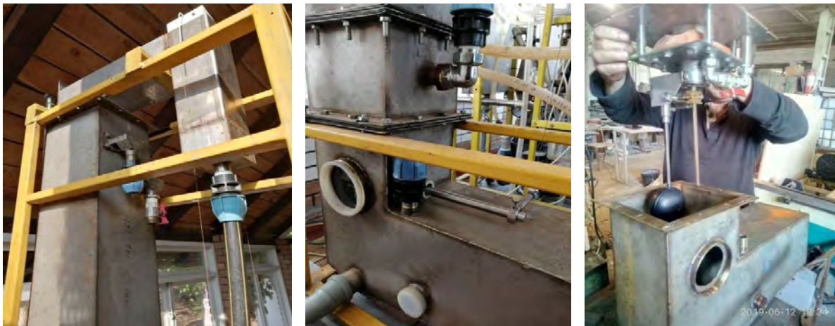
а) б) в) Рис. 3. Зовнішній вигляд фільтрувального блоку АСОВ: а – контролер подачі води на фільтр та промивки фільтра з поплавком зриву вакууму головного клапана; б – прийомна ємність промивної води з важелем зриву вакууму; в – комбінований мембранний клапан промивки фільтра з контр-поплавком

токсинів, вірусів, антибіотиків, мікро-водоростей та пестицидів тощо. Далі вода направляється в блок узгодження подачі 8, де йде включення всього спектра впливів: комбінаційне осадження одним чи декількома коагулянтами, електролізна коагуляційна інтенсифікація виділення, електролізне окиснення, пряме, додаткове, окиснення киснем, хлором тощо, акустичним ультразвуком, гідродинамічною кавітацією, температурою, світлом, магнітною обробкою, деструкцією імпульсним електролізом, фільтруванням, органічною обробкою.