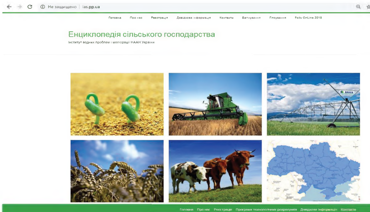
Рис. 4. Графічний інтерфейс меню головної сторінки інформаційно-аналітичної «Системи підтримки прийняття рішень у землеробстві»

надання «он-лайн» консультаційних послуг через мережу Інтернет з управління технологіями у меліоративному землеробстві і впровадження інтегрованих підходів до управління водними та земельними ресурсами на меліорованих територіях забезпечують високий рівень супроводу зацікавлених сторін з ефективного використання водних та земельних ресурсів.