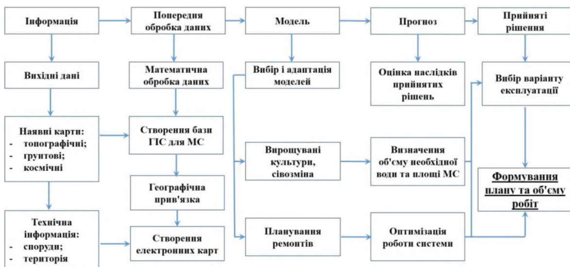
Рис. 1. Структурно-функціональна схема забезпечення користувача єдиною точкою доступу до накопиченої інформації